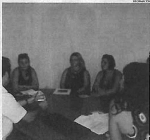
Imagen de la reunión con los delegados municipales de Turismo.

Entre los acuerdos adoptados está la firma de un convenio entre todas las partes interesadas para poner en valor de forma conjunta las 10 rutas ecuestres diseñadas, así como comenzar con labor de promoción de las mismas entre el empresariado local.