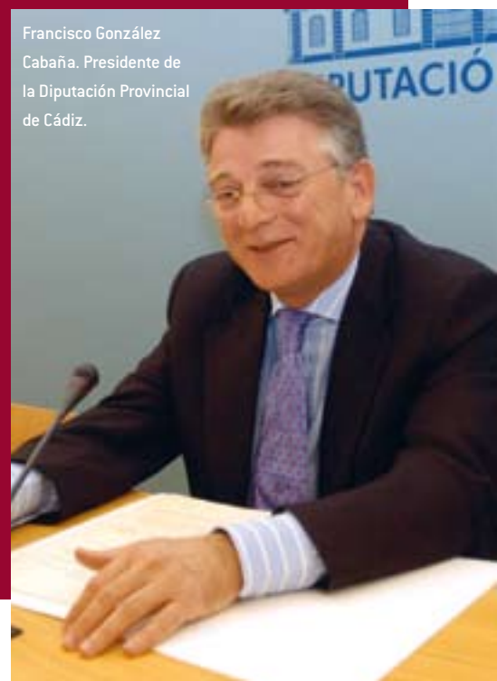
Francisco González Cabaña. Presidente de la Diputación Provincial de Cádiz.

Barbate, Conil, Vejer y en el nuevo marco Tarifa, conforman un conjunto de municipios con unas características socioeconómicas y medioambientales de tal similitud que juntos van a lograr un importante progreso en los próximos años. En este avance, no me cabe ninguna duda, que el desarrollo rural de la mano del GDR será un apoyo muy importante para conseguir los objetivos del futuro”.