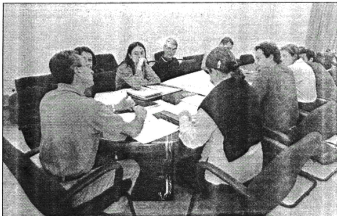
Reunión del Grupo de Investigación sobre Planificación y Gestión Litoral de la UCA

En este caso el marco geográfico donde va a centrarse el estudio, como ya se ha mencionado anteriormente, abarca a los términos municipales costeros de la citada comarca: Conil, Barbate y Vejer de la Frontera. A esta zona se le va a aplicar lo que en términos técnicos se denomina PGIAL o lo que es lo mismo Planificación y Gestión Integradas de Áreas Litorales. En la actualidad es una de las zonas de la provincia que mejores potencialidades económicas tiene en cuanto al desarrollo económico desde el punto de vista turístico.