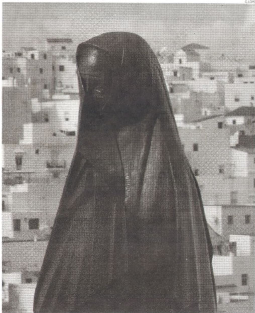
Imagen un primer plano de la escultura de La Cobijada, al fondo el pueblo de Vejer.

"Conocer, conservar y poner en valor nuestro patrimonio es tarea de todos y todas nosotros. Si bien es verdad que los poderes públicos tienen una responsabilidad importante en la conservación de nuestro patrimonio, los ciudadanos de a pie también somos responsables, y por tanto tenemos que contribuir a ello" argumentaba Castro añadiendo que "la conservación debe llevar aparejada utilización, y por ello es necesario que conozcamos bien nuestros recursos para dotarlos de la