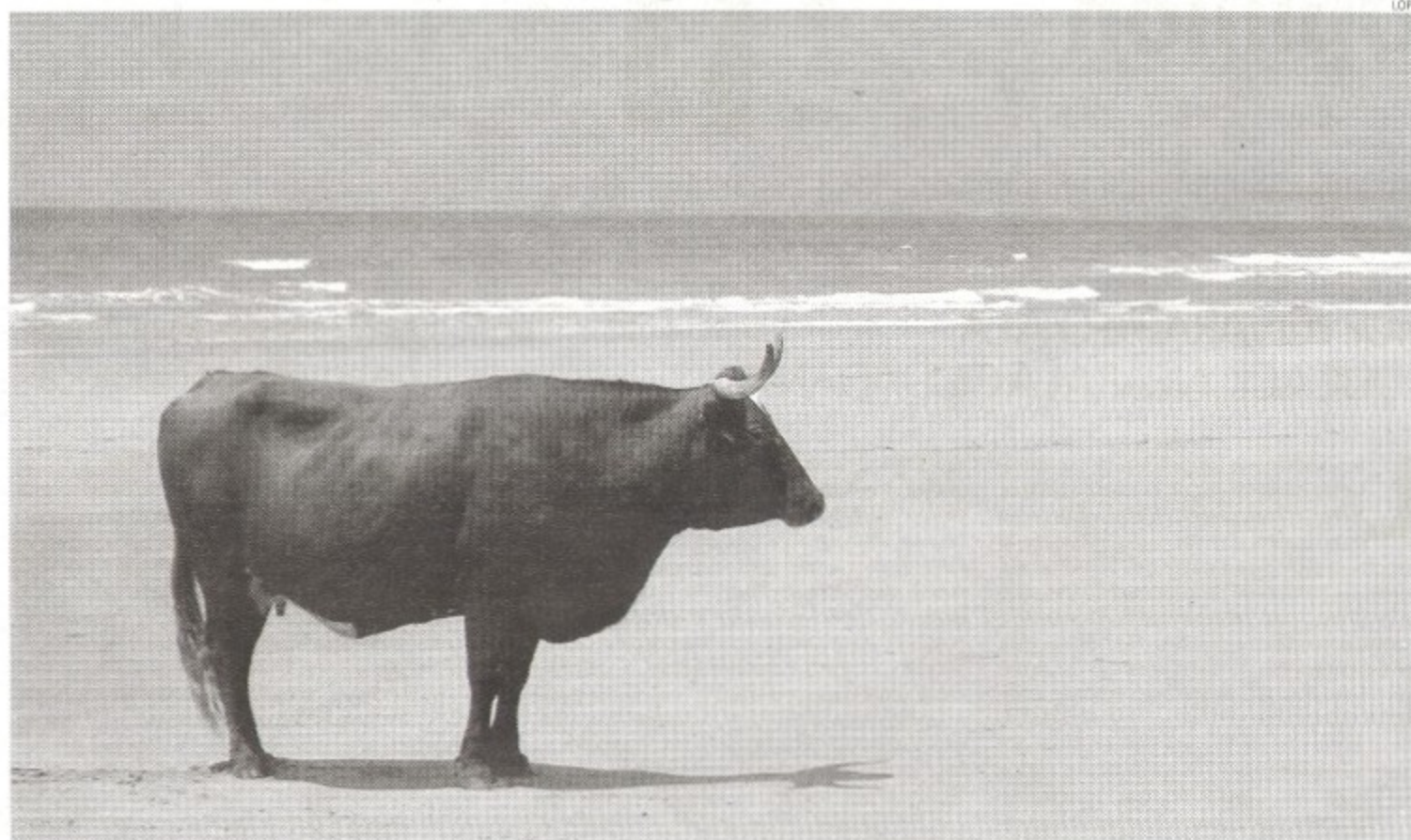
La torre del Tajo, espectacular...

Mientras, la exposición El Patrimonio Rural del Litoral de La Janda estará abierta al público de lunes a sábado hasta el 28 de mayo y en horario de 11.00 a 13.30 horas y de 17.30 a 20.00 horas; los sábados de 11.00 a 14.00 horas en el antiguo convento de las Monjas Concepcionistas.