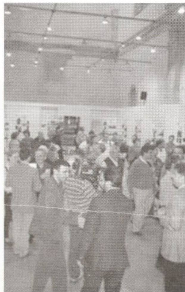
Imagen de la inauguración de la exposición.