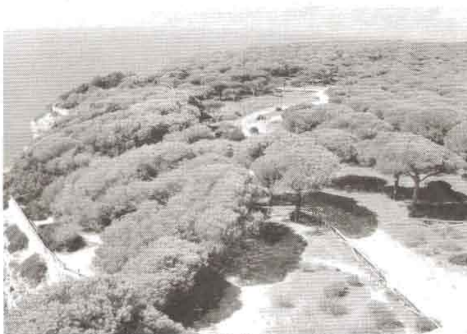
En total se ha promovido una inversión conjunta de 7,3 millones de euros entre los años 2000 y 2006.

Entre los proyectos apoyados con los programas de desarrollo rural cabe citar: Guía Turística de Vejer de la Frontera, Guía Turística de Conil de la Frontera, la creación de la Asociación Empresarial "Turismo Janda Litoral", la realización de un programa de formación en comercialización turística, idiomas y nuevas tecnologías, etc. También se han apoyado alojamientos tan emblemáticos como: Hotel Almadraba, Hotel Pradillo, Hotel VVejer, Hostal La Botica, Hotel Adiafa, etc., o en la modalidad de turismo rural como: Hotel Rural 'El Palomar de la Breña', Hotel Rural 'Sindhura', Casa Rural 'El Limonero'. También se han concedido ayudas para la creación de los restaurantes como 'El Asador' y 'El Jabibi', o para la modernización de enseñanzas gastronómicas de la Comarca como es el caso del restaurante 'El Campero'.