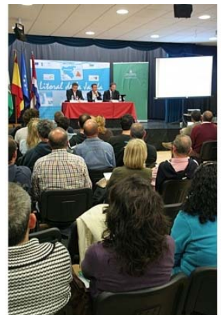
Fueron muchos los empresarios y asociaciones que acudieron a la presentación del Plan Global del GDR para los próximos años

En la presentación formal del Plan Global se realizó un breve génesis del GDR La Janda-Litoral que funcionando desde hace más de 10 años mantiene 80 asociados de los cuales tan sólo 12 son empresas de carácter público, llevando la voz cantante la iniciativa privada. De igual modo se repasó el Programa Andalucía 2007-2013, la estrategia de actuación y los fondos Líder. Así a través del GDR los empresarios locales consiguieron familiarizarse con las subvenciones provenientes de los Fondos Líder que ayudarán a hacer realidad iniciativas comerciales enmarcadas en el entorno natural. El grupo de desarrollo rural quiere así fomentar la economía sostenible en los municipios adscritos a su área de influencia.