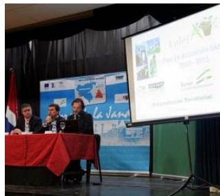
El delegado provincial de Agricultura y Pesca junto al alcalde de Tarifa y al presidente del GDR La Janda-Litoral