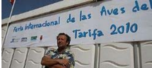
Beltrán Ceballos aprovecha la celebración de este evento para señalar que los beneficios de cualquier desarrollo debe repercutir en las zonas rurales